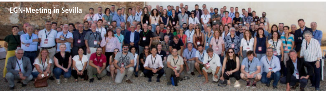
EGN-Meeting in Sevilla

Vom 23. bis 24. September waren wir in Sevilla. Zweimal im Jahr treffen sich die Vertreter der 75 Europäischen UNESCO Global Geoparks, um Projektpartnerschaften weiterzuentwickeln. Gastgeber war der Geopark Sierra Norte de Sevilla. Eine Exkursion führte in den Geopark Subbeticas - den zweiten von insgesamt drei andalusischen Geoparks. Im Anschluss fand die europäische Geoparkkonferenz statt, an der Besucher aus der ganzen Welt teilnahmen, darunter Politiker, Behörden und Regionalentwickler.