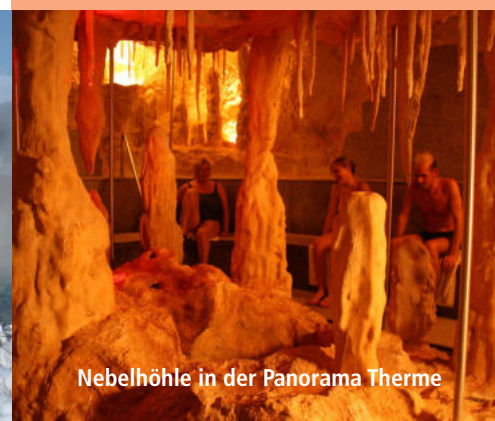
Nebelhöhle in der Panorama Therme

Bei Schmuddelwetter bietet sich ein Besuch in der Thermen- und Saunalandschaft mit ihren dampfenden warmen Becken und den vielen Schwitz- und Wärmeräumen an. Ein Tag in der Therme ist wohltuend, entspannend und gesundheitsfördernd. Regelmäßige Saunagänge stärken das Immunsystem und der Besuch des Salzstollens, in dem 5%-ige Sole vernebelt wird, ist eine Wohltat für gereizte Atemwege oder trockene „Winterhaut“.